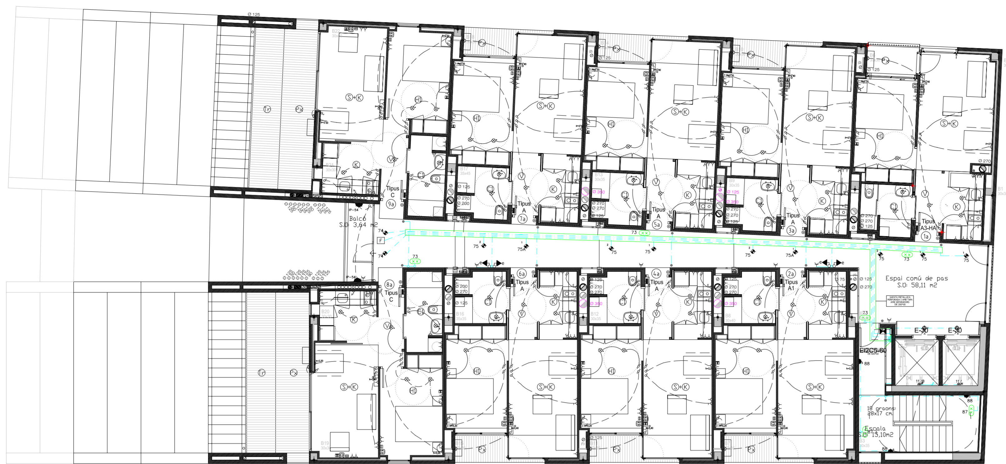
PLANTA QUARTA (BLOC B) +25,51 TOTAL SUPERFÍCIE CONSTRUÏDA 547,31 M 2 SUPERFÍCIE SOSTRE OCUPAT 549,18 M 2