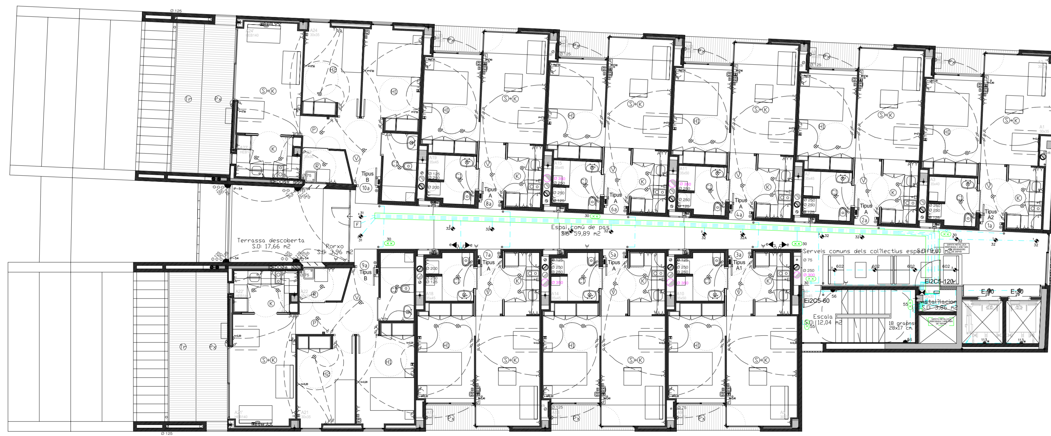
PLANTA TERCERA (BLOC A) +22.45 TOTAL SUPERFÍCIE CONSTRUÏDA 650.58 M 2 SUPERFÍCIE SOSTRE OCUPAT 645.45 M 2