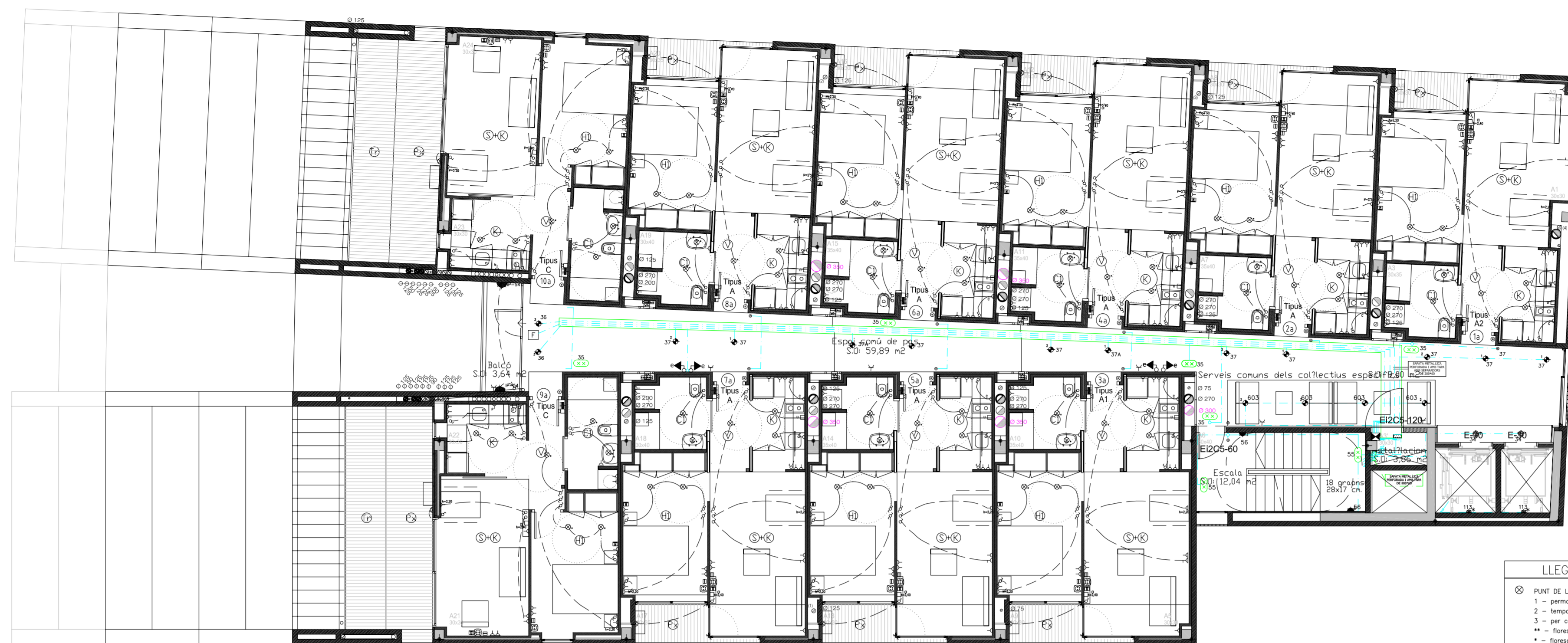
PLANTA QUARTA (BLOC A) +25.51 TOTAL SUPERFÍCIE CONSTRUÏDA 606.76 M 2 SUPERFÍCIE SOSTRE OCUPAT 607.63 M 2