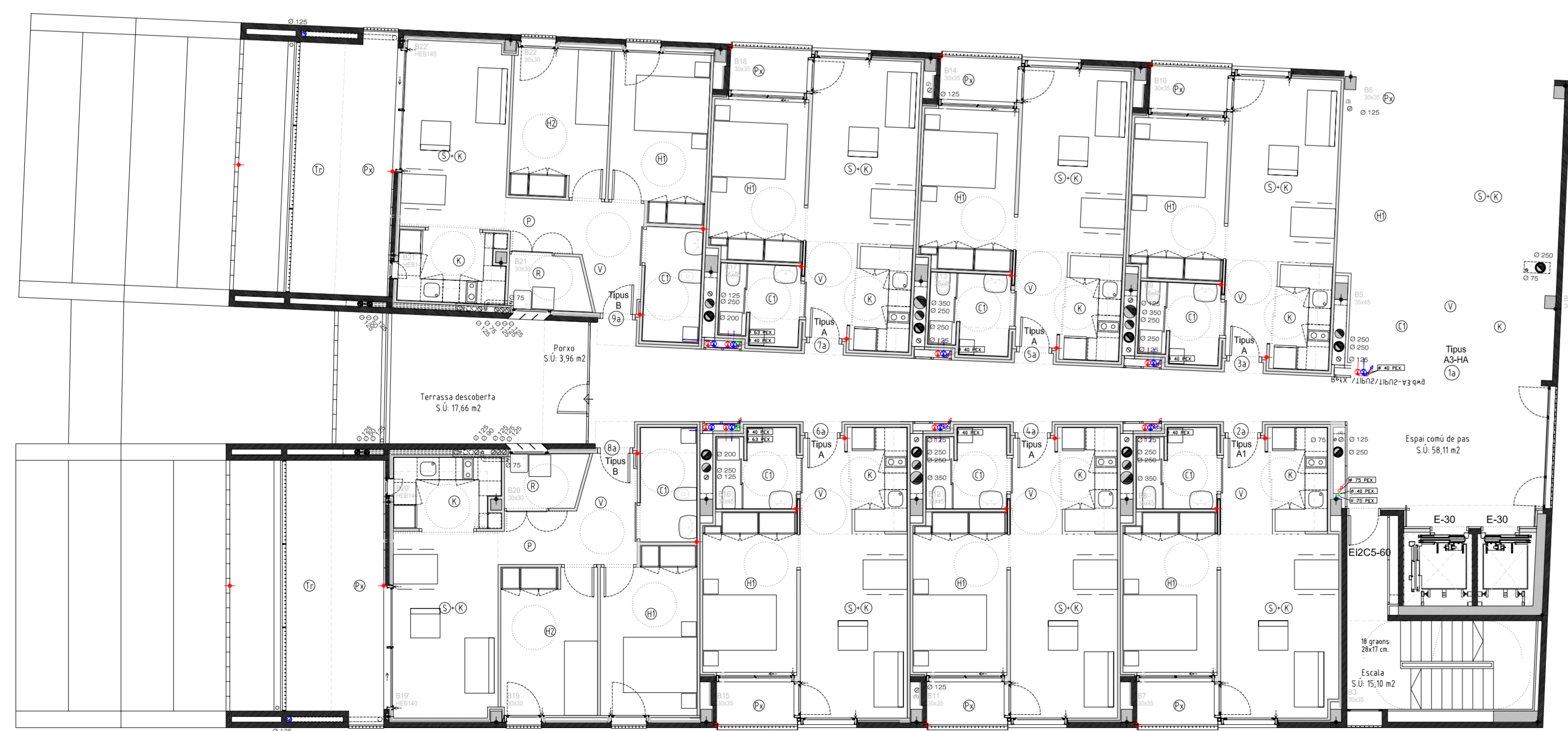
PLANTA TERCERA (BLOC B) +22.45 TOTAL SUPERFÍCIE CONSTRUÏDA: 361.14 m² SUPERFÍCIE SOSTRE OCUPAT: 360.98 m²