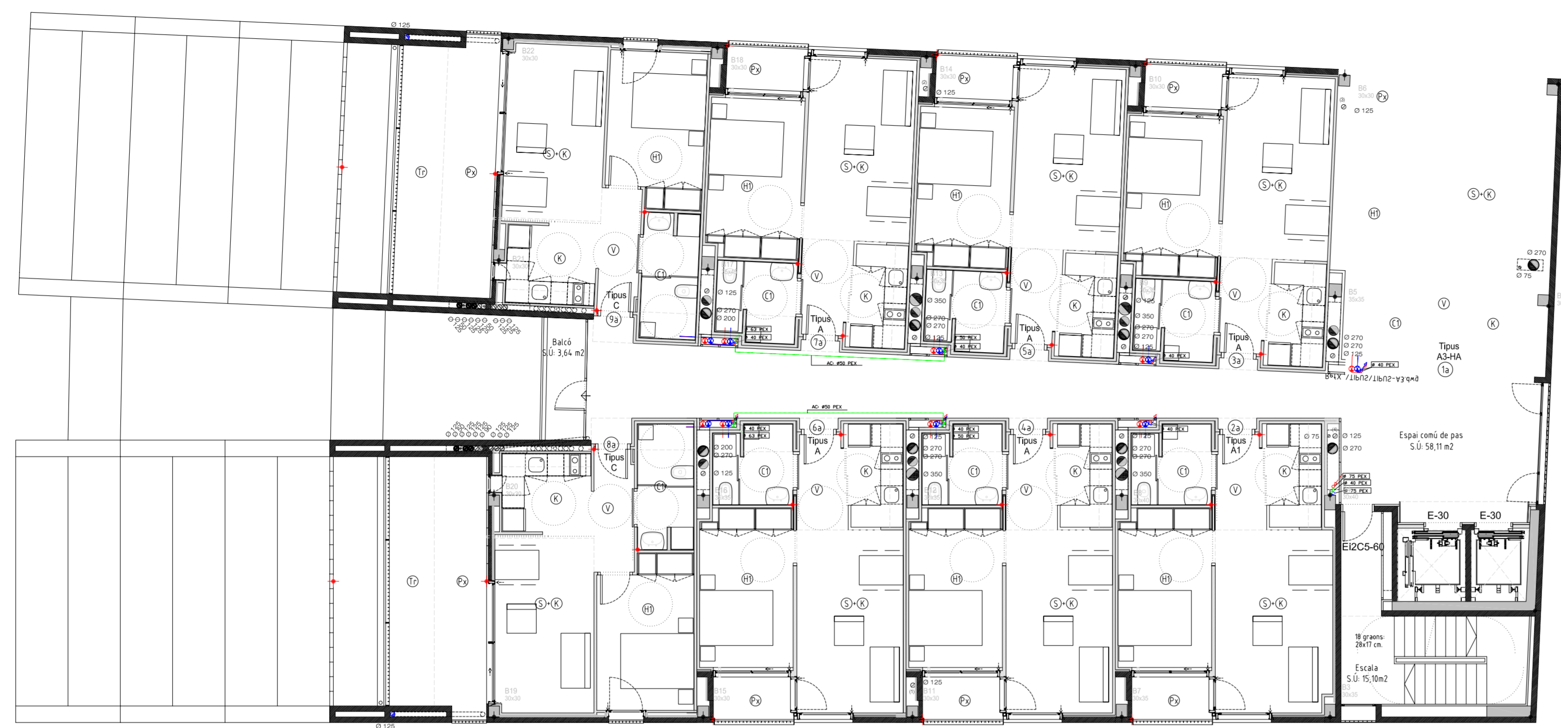
PLANTA QUARTA (BLOC B) +25.51 TOTAL SUPERFÍCIE CONSTRUÏDA: 361.14 m² SUPERFÍCIE SOSTRE OCUPAT: 342.58 m²