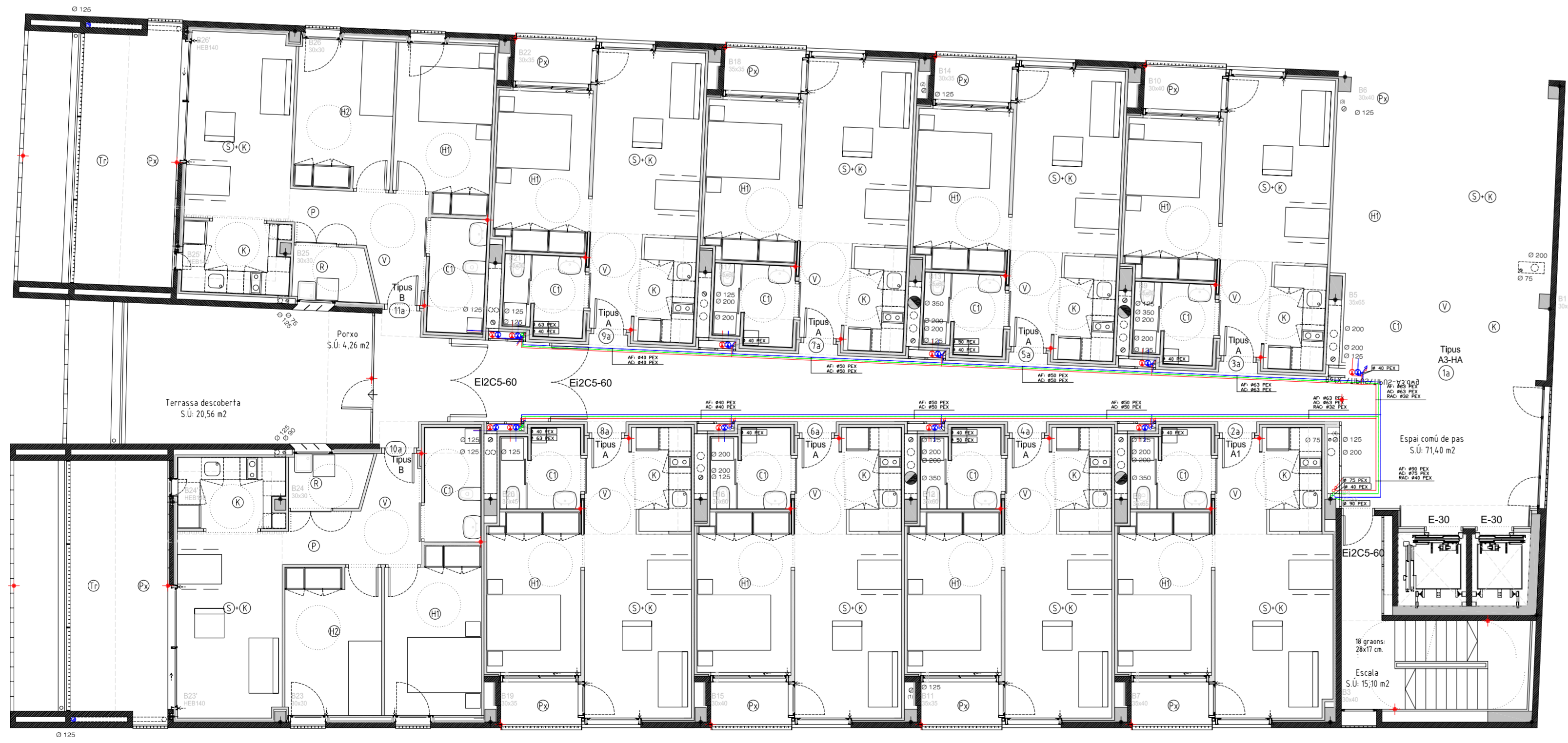
PLANTA PRIMERA (BLOC B) +16,33 SUPERFÍCIE SOSTRE COBERT 286,75 m 2