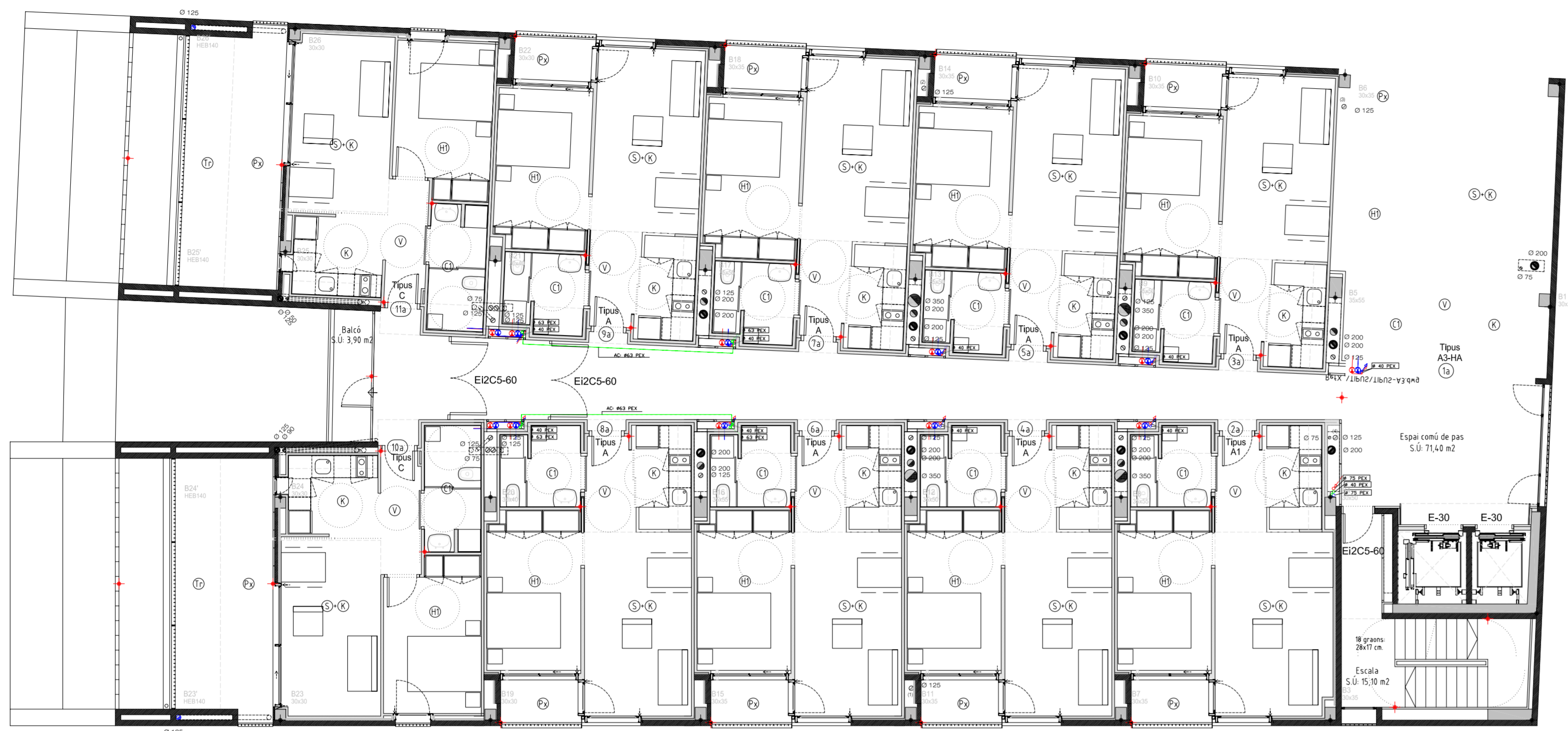
PLANTA SEGONA (BLOC B) +19,39 SUPERFÍCIE SOSTRE COBERT 286,75 m 2