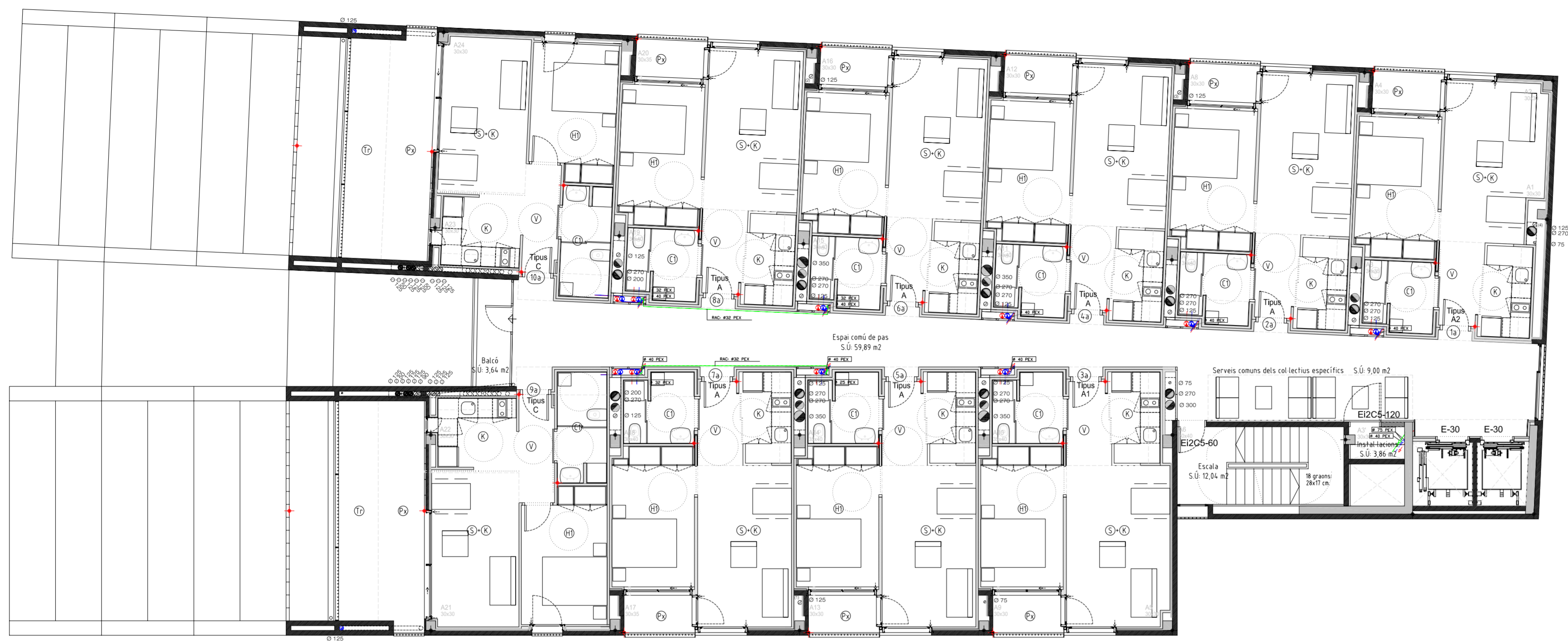
PLANTA QUARTA (BLOC A) +25.51 CENTRE SUPLENIDOR DE SERRALLONGA 000.00.000 SUPERFÍCIE SOSTRE OCUPAT 660.83 M 2