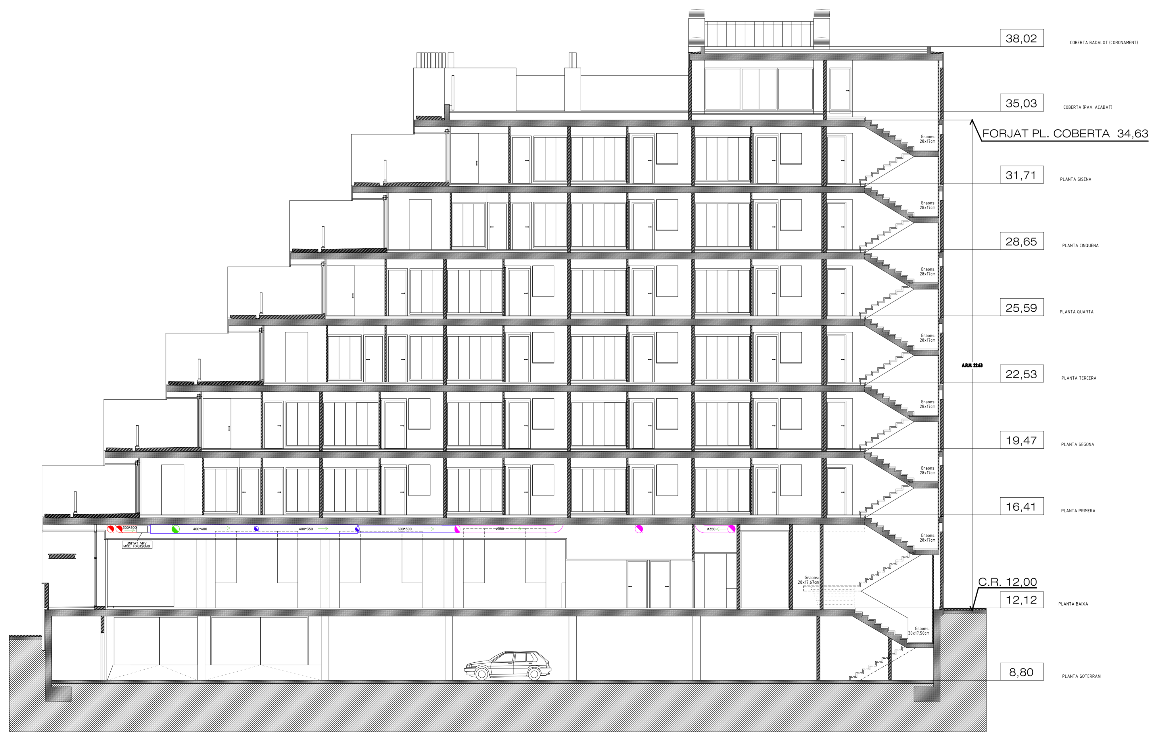
SECCIÓ LONGITUDINAL B-L1