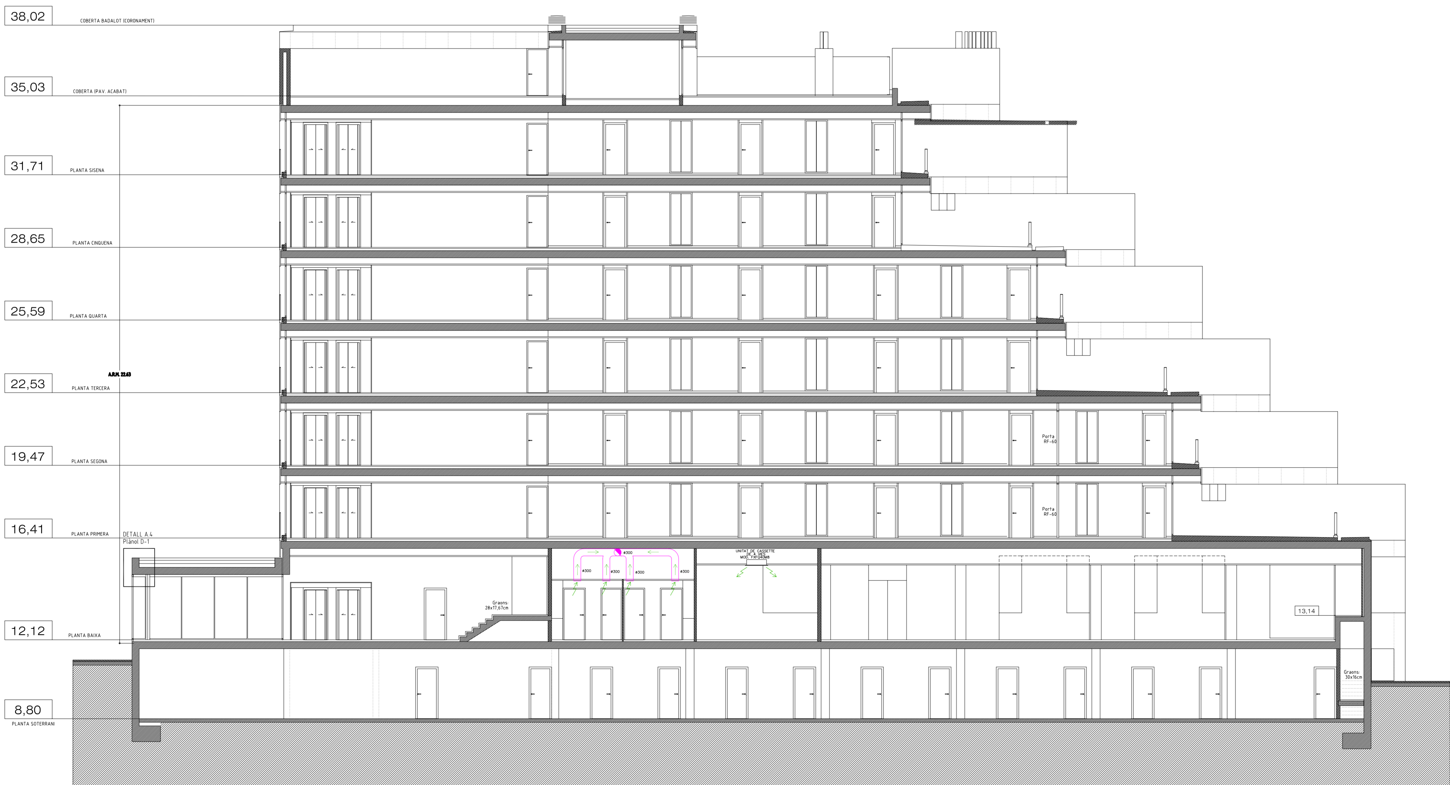
SECCIÓ LONGITUDINAL A-L2