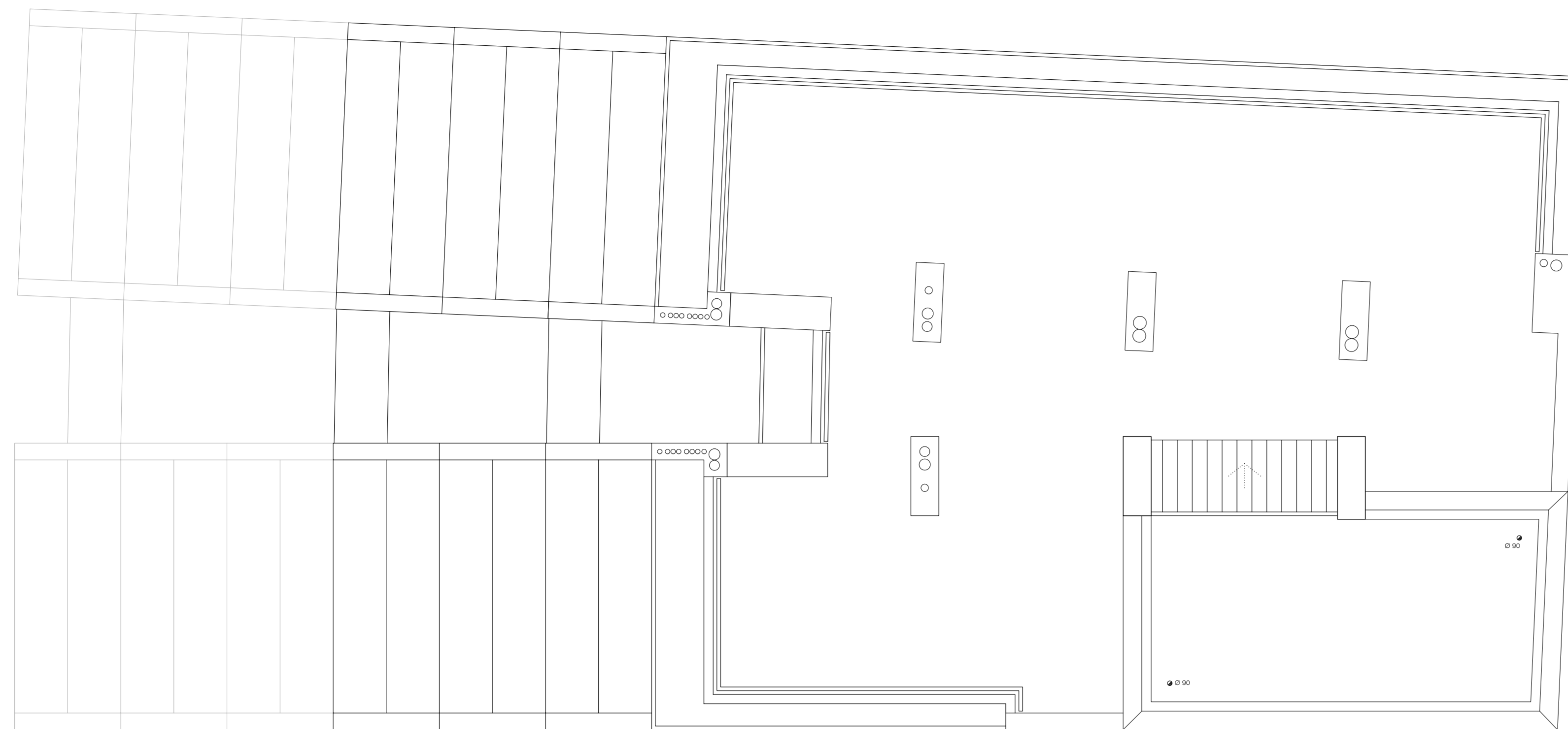
PLANTA COBERTA (BLOC B)

EL N.º DE CIRCUITS DE TERRA RADIAN PER HABITATGE SERA DE 5 A 7 SEGONS FIXES DE CALCULS HIDRAULIC