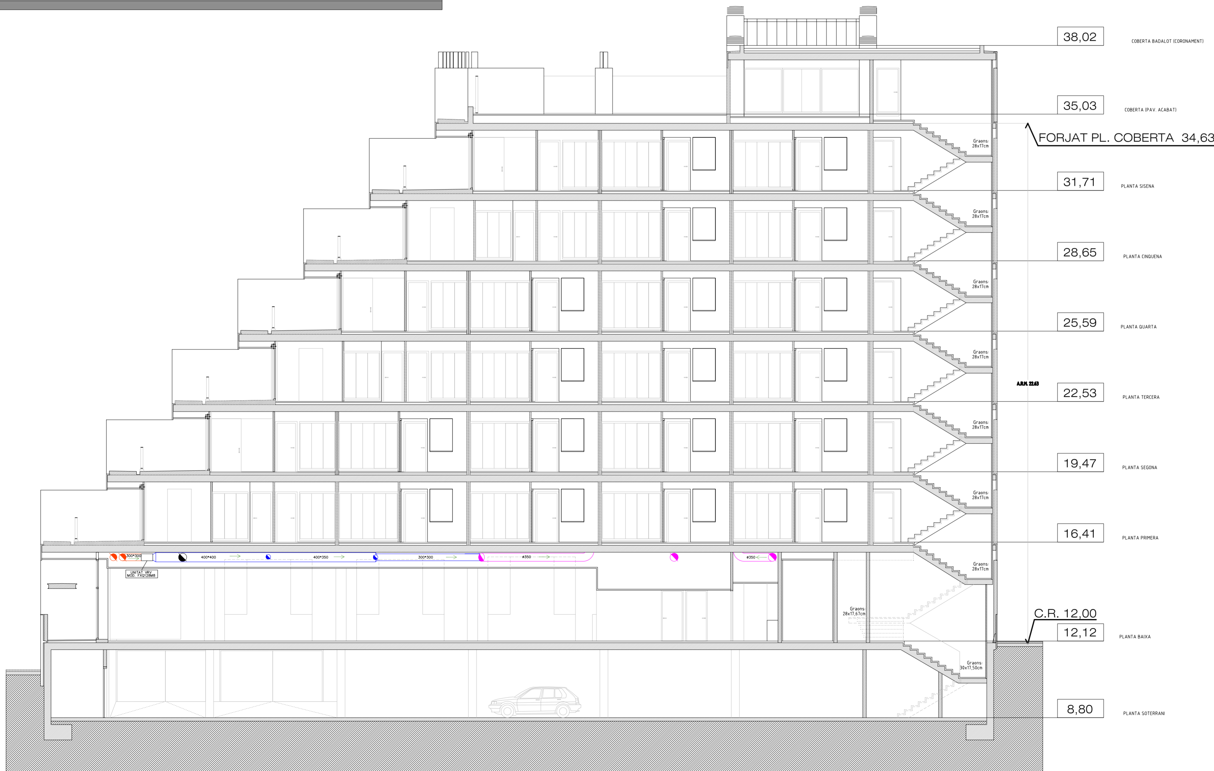
SECCIÓ LONGITUDINAL B-L1