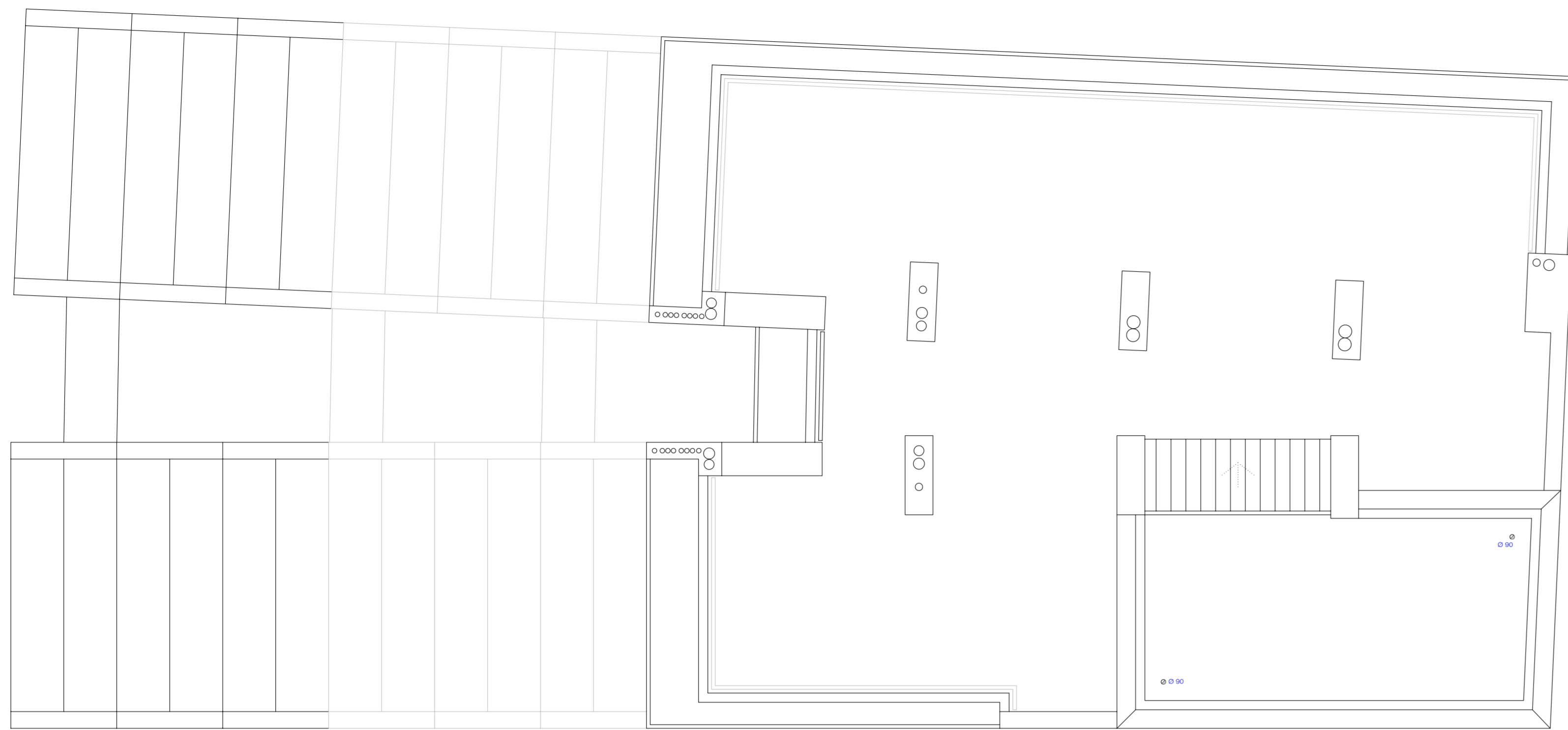
PLANTA COBERTA (BLOC B)