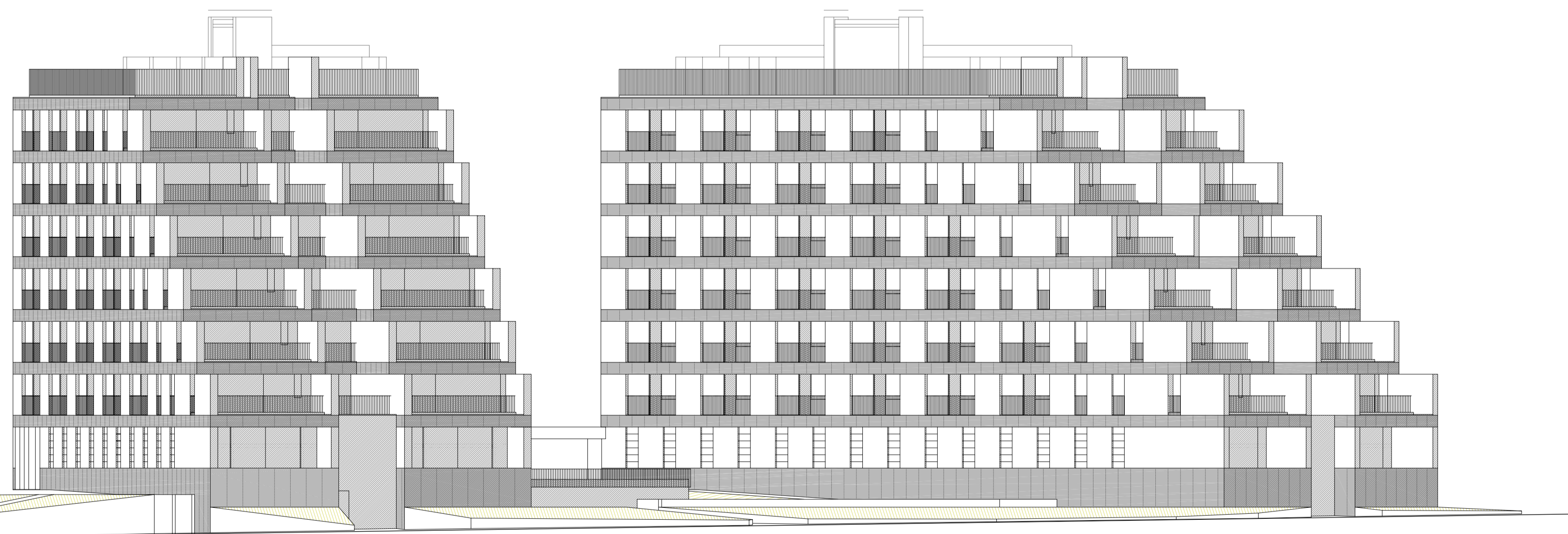
ALÇAT c/ Leonardo da Vinci