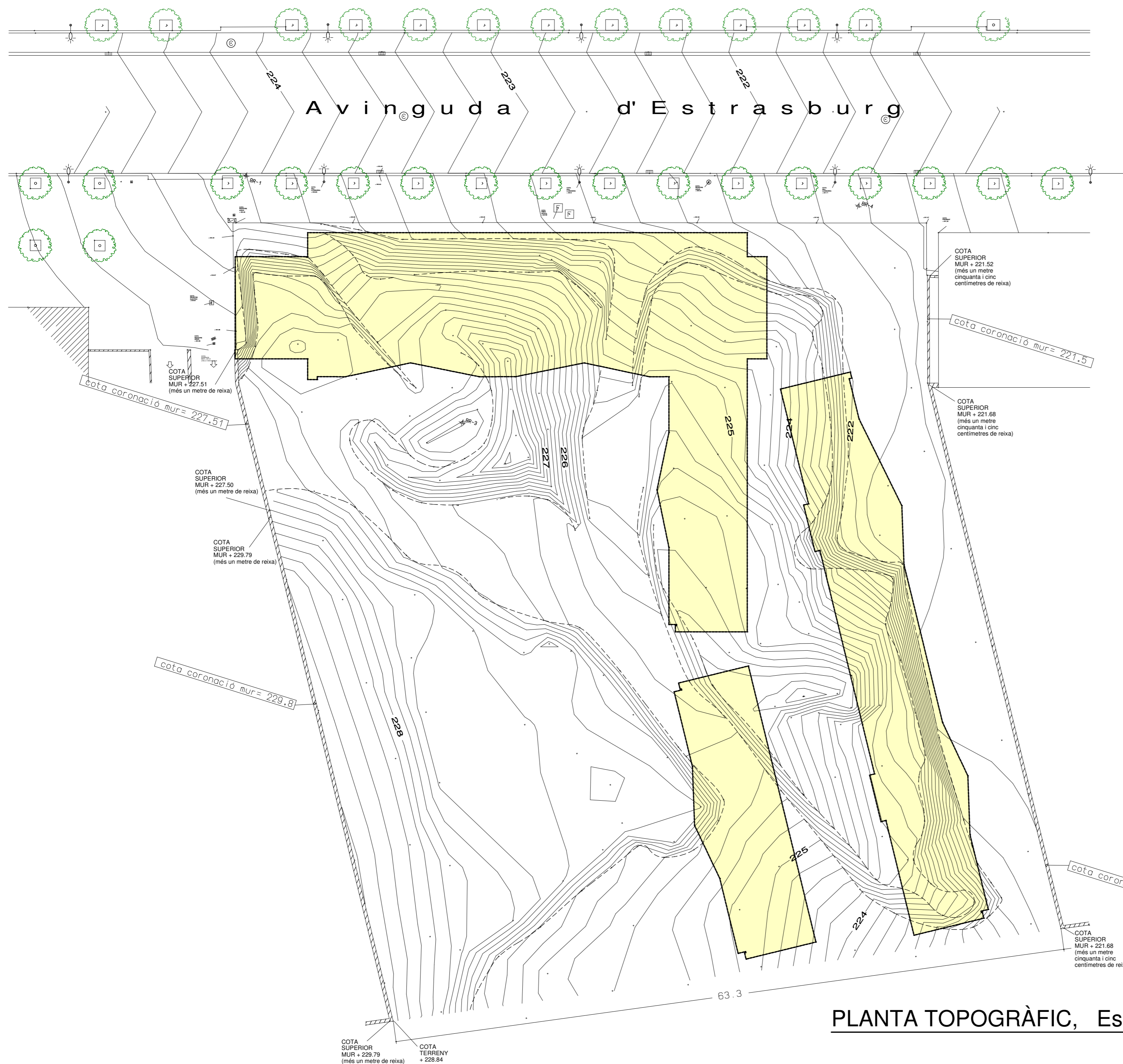
PLANTA TOPOGRÀFIC, Esc. 1:250